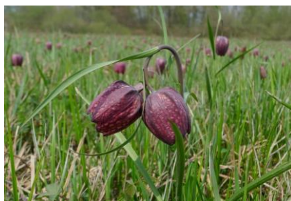
Slika 3: Močvirska logarica.