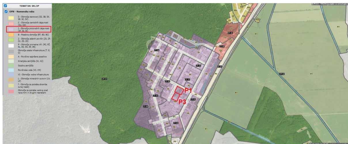
Slika 1: Lokacija stavb podjetja Kimi d.o.o. v OIC Trzin.

Podjetje Kimi d.o.o. se nahaja v OIC Trzin. Sedež podjetja in proizvodnja sta na naslovu Planjava 1, skladišče na naslovu Planjava 3. Lokacija obeh stavb je označena na Sliki 1. Obe stavbi ležita na območju proizvodnih dejavnosti (vijolično).