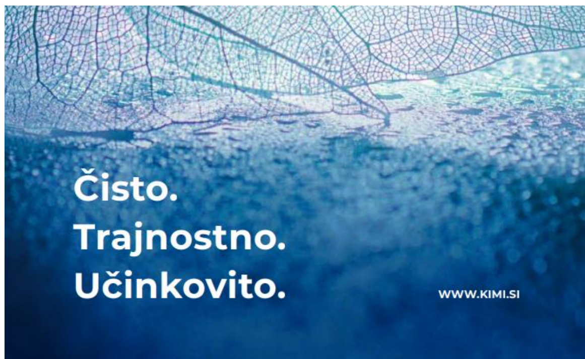
Slika 5: Izšel je novi trajnostni katalog.

V letu 2022 je izšel novi trajnostni katalog. Dosegljiv je na spletni strani https://www.kimi.si/wp-content/uploads/2022/08/KIMI-trajnostni-katalog-2022.pdf . Na katalog smo izredno ponosni, saj so vanj zajeti rezultati naših prizadevanj na področju trajnosti.