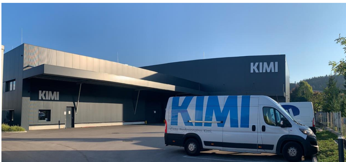
Slika 4: Novo visokoregalno skladišče.

V letu 2021 smo zaključili z gradnjo visokoregalnega skladišča, tik ob objektu za proizvodnjo. Skladišče je zgrajeno po najzahtevnejših standardih za gradnjo industrijskih objektov, osvetlujejo ga varčne LED luči na senzor. Z izgradnjo visokoregalnega skladišča smo močno zmanjšali skupne izpuste CO 2 , saj prevozi do zunanjih skladišč niso več potrebni.