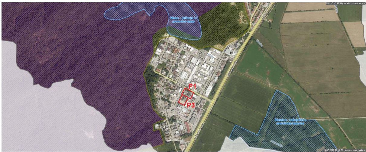
Slika 2: Zaščitena območja v občini Trzin (modro).