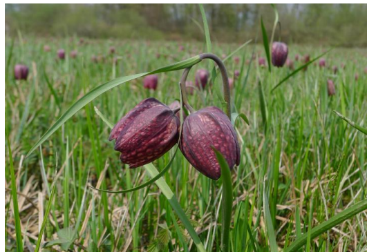
Slika 3: Močvirska logarica.